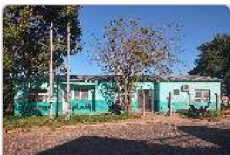
Fachada do ESF 01 Cohab