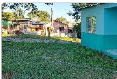
Parte frontal do Terreno.

Não existem informações a serem apresentadas.