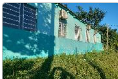
Parte dos fundos do ESF 01 Cohab