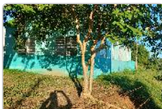
Lado esquerdo do Terreno do ESF01 Cohab