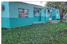
Frente do Terreno do ESF 01 Cohab