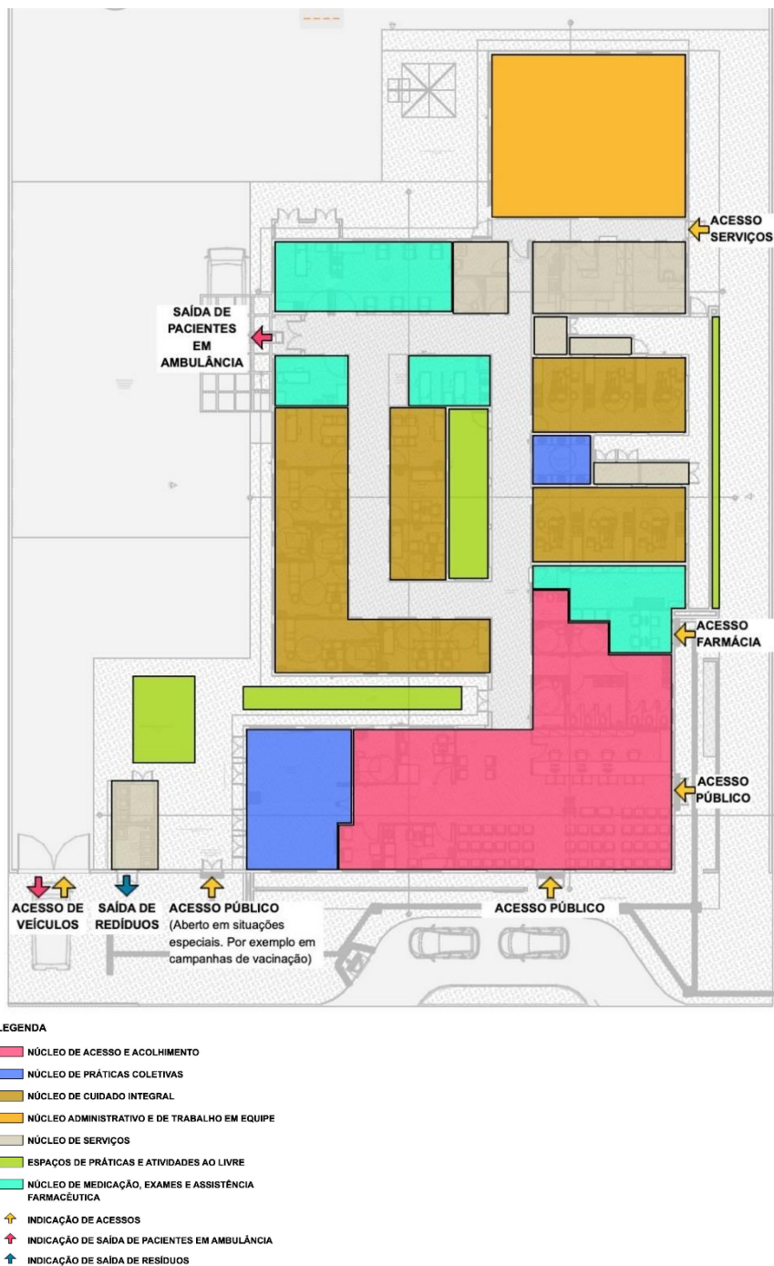
Figura 2: Arranjo espacial dos núcleos e seus fluxos