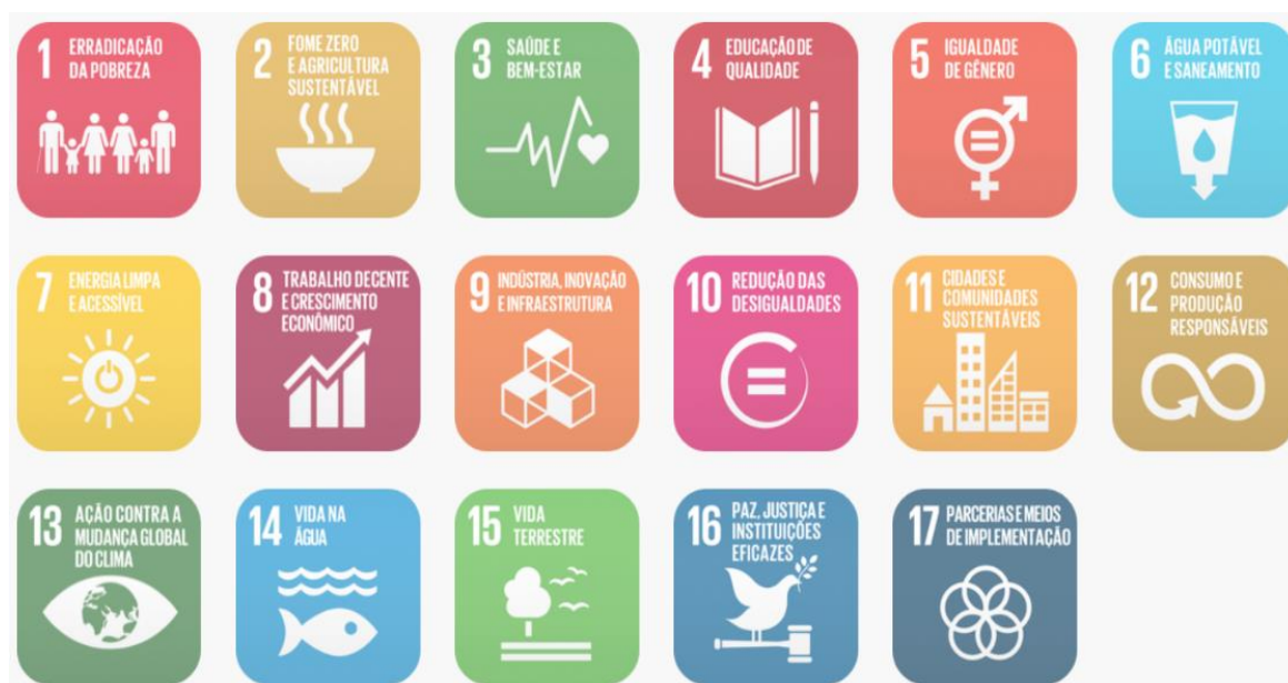
Figura 02: Objetivos de Desenvolvimento Sustentável

Em fortalecimento aos compromissos firmados pelo governo federal junto a ONU que fazem parte dos Objetivos de Desenvolvimento Sustentável – ODS, articulados através da agenda 2030, este projeto promove a utilização de estratégias para construção de edificações sustentáveis, como forma de garantir a sua resiliência e adaptabilidade em meio às mudanças climáticas. Sendo assim ele foi desenvolvido com a utilização de sistemas construtivos capazes de contribuir para a preservação e conservação do meio ambiente, diminuindo o uso e o esgotamento dos recursos naturais, a produção de resíduos e o consumo de energia.