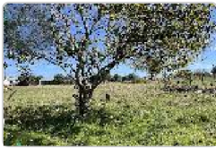
WhatsApp Image 2025-07-30 ...

Não existem informações a serem apresentadas.