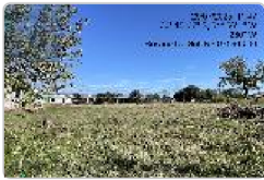
WhatsApp Image 2025-07-30 ...