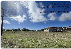
WhatsApp Image 2025-07-30 ...

Não existem informações a serem apresentadas.